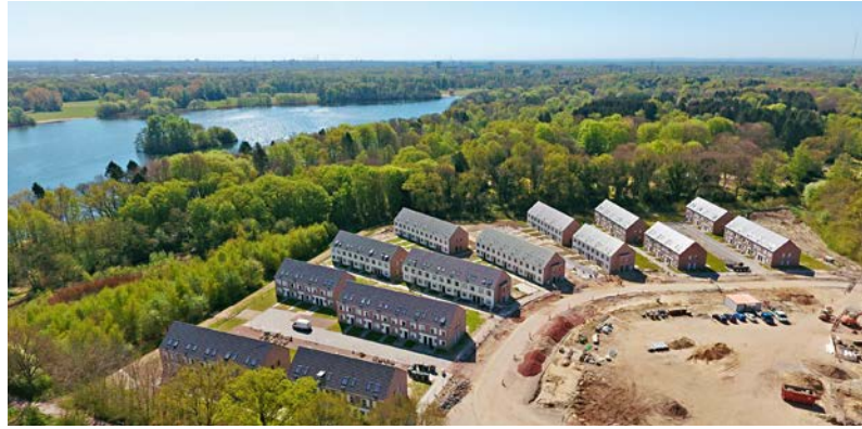
Das neue Quartier entsteht direkt am Öjendorfer See, einem beliebten Ausflugsziel, das auch gut mit öffentlichen Verkehrsmitteln erreicht wird