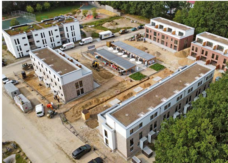
Luftaufnahme der Duplex-Reihenhäuser, die im zweiten Bauabschnitt im Quartier Haferblöcken entstehen

Geschäftsführer Dornieden Baumanagement GmbH MÖNCHENGLADBACH